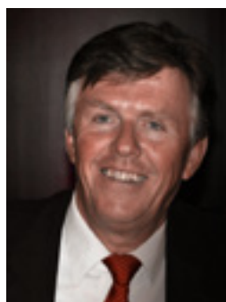
Yves WIGT Maire