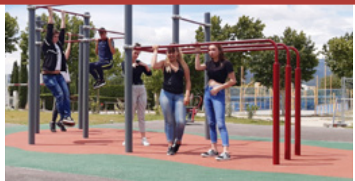
Pump it up !

la création d'une zone partagée entre tous les utilisateurs dont les vélos, la réfection de l'éclairage public en led, la mise en place d'espaces verts moins énergivores en eau, la mise en valeur de la place des Alliés, l'entrée du cimetière, la réfection de la place de la Trashumance. Le résultat est là ! Charleval entre dans une ère moderne et améliore son cadre de vie au quotidien. La place André Leblanc sera réhabilitée à compter de fin septembre pour finir ce chantier d'envergure, et ensuite la municipalité entamera la dernière partie, la partie ouest côté cadenières.